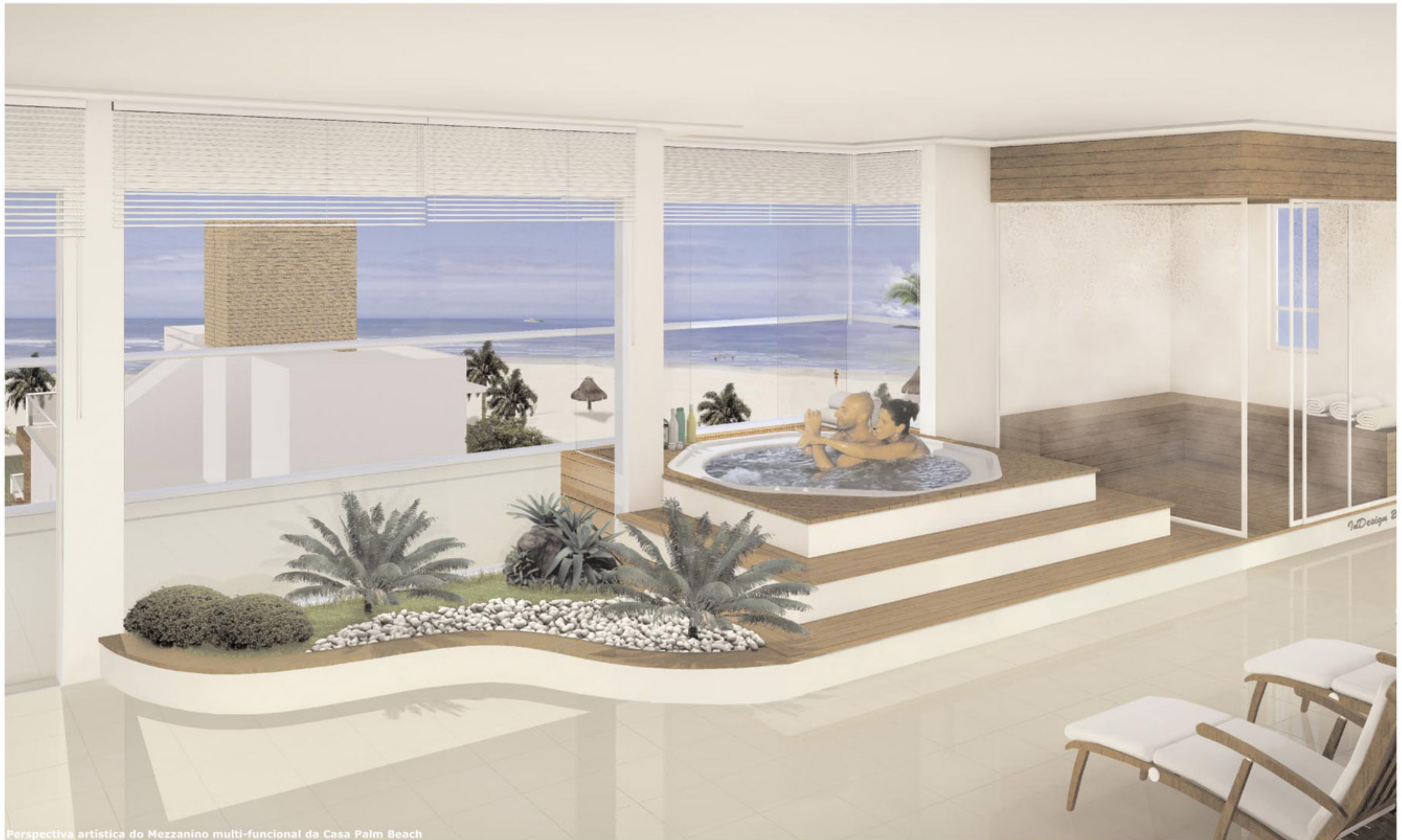
Perspectiva artística do Mezzanino multi-funcional da Casa Palm Beach

Móveis e decoração de dimensões comerciais, não fazendo parte do contrato de vendas.