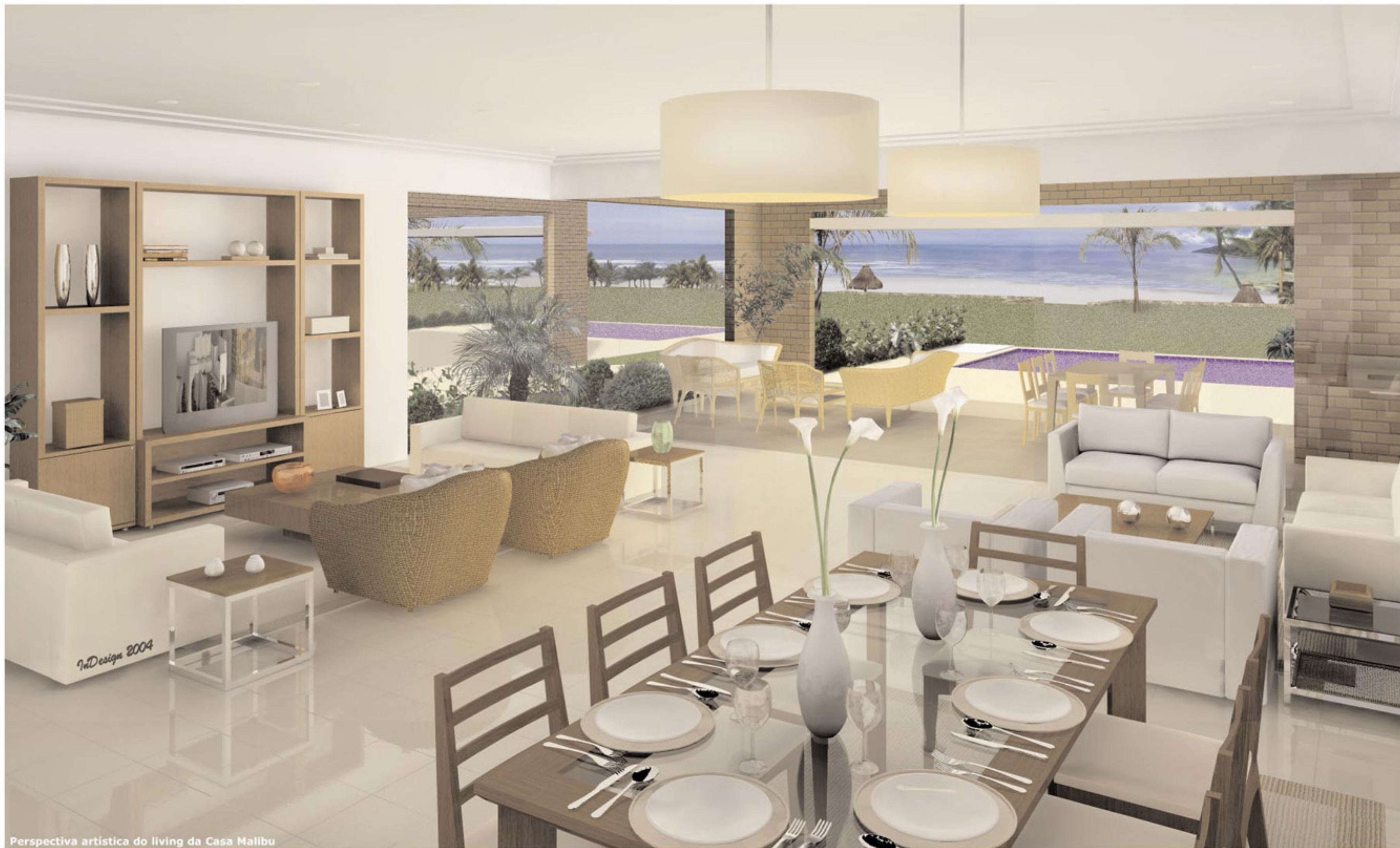
Perspectiva artística do living da Casa Malibu

Móveis e decoração de dimensões comerciais, não fazendo parte do contrato de vendas.