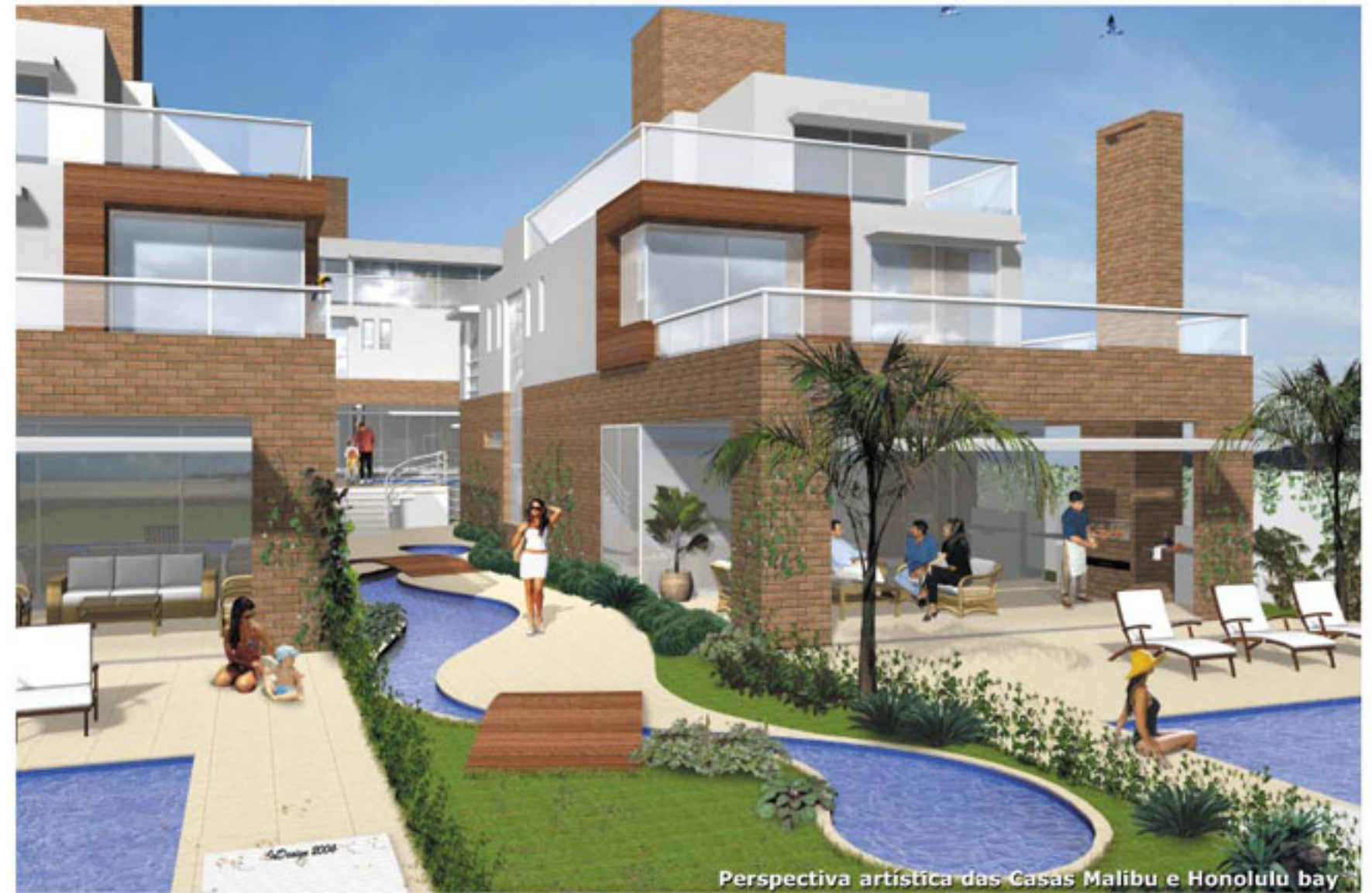
Perspectiva artística das Casas Malibu e Honolulu bay