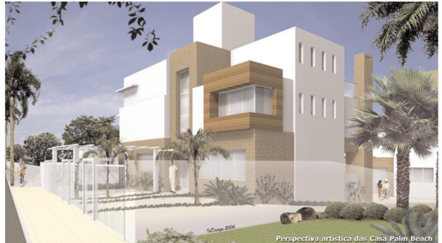
Perspectiva artística das Casa Palm Beach