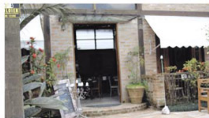
A Tal da pizza